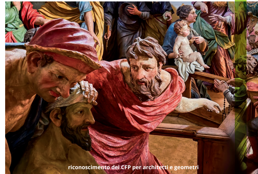
riconoscimento dei CFP per architetti e geometri

in sinergia con l'Ufficio Scolastico Regionale per il Piemonte Ambiti Territoriali di Biella, Novara, VCO, Vercelli